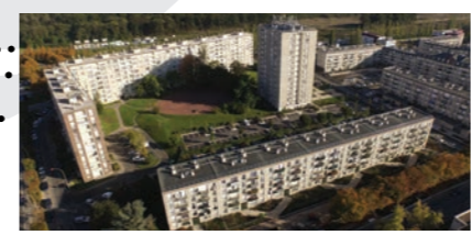
1 Lorient Démolition de la Tour Lorient Rénovation énergétique et résidentialisation de l'équerre Création d'un espace vert qualitatif et participatif

Dès l'automne, l'équipe de la Gestion Urbaine et Sociale de Proximité de la Ville, lancera le projet mémoire avec les habitants volontaires, comme cela a été fait sur Gaston Tunc dans le premier projet ANRU (exposition, livret, photos...).