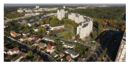
2 Chateaubriand-Lamartine Démolition de l'arc de Chateaubriand et de la Tour Lamartine Création de logements neufs Réaménagement du parc de Beauregard