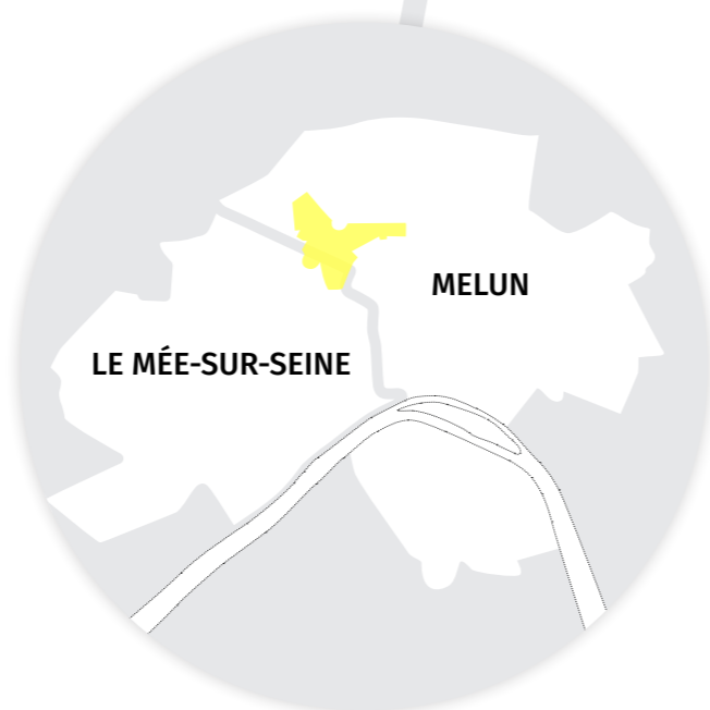
Périmètre du NPRU