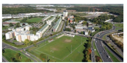
6 Schuman Rénovation énergétique et résidentialisation de la tour Clause de revoyure : étude urbaine complémentaire et concertation