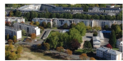
4 Jardins de l'Europe (ex-Plateau de Corbeil) Rénovation du groupe scolaire Jules Ferry