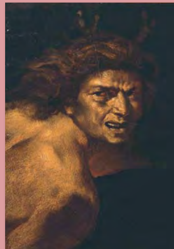
Eugène DELACROIX, Étude d'Actéon , XIX e siècle.