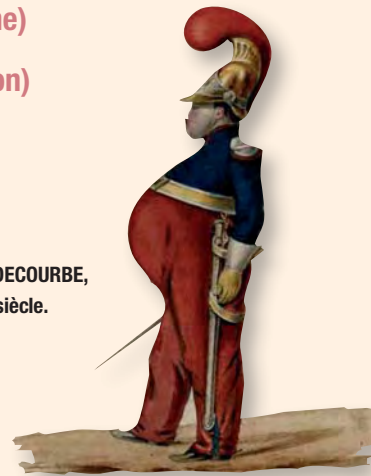
F-J. DECOURBE, XIX e siècle.

Atelier : réalisation d'un tableau en mosaïque (dès 6 ans)