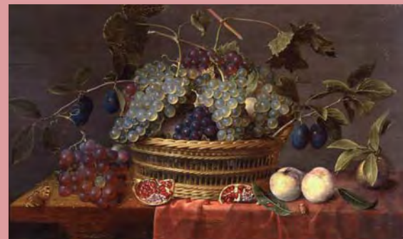
J. Van HULSDONCK, Nature morte à la corbeille de raisins , XVII e siècle.

Le Conservatoire de musique et de danse de Melun propose un programme de chants et de musiques autour de l'installation de l'artiste plasticien Dany Lof .