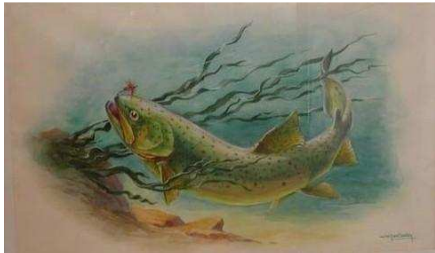
Aquarelle H 44.5 x L 64 cm

https://picasaweb.google.com/116577003003622482515/EnsembleDeDessinsParLePeintreJacquesCartier