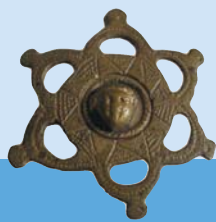
Flacon; Support de vase en forme d'amphithéâtre; Fibule (épingle pour agraffer les vêtements).