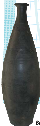
Bouteille de fête en terre cuite noire lustrée.