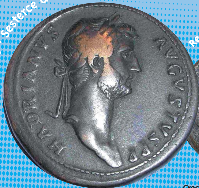
Buste de l'empereur Hadrien