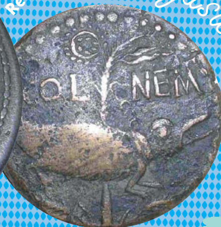
Crocodile enchaîné à un palmier, symbole de la prise d'Égypte en 30 av. JC

As, sesterces et deniers étaient les monnaies les plus couramment utilisées à l'époque gallo-romaine. Dans la vitrine centrale tu peux en voir quelques-unes parmi celles qui ont été découvertes à Melun.