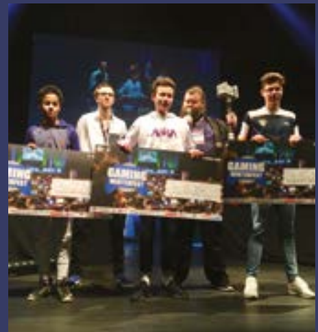
Et de nombreux prix ont été gagnés.