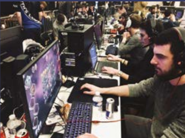
Des joueurs motivés !