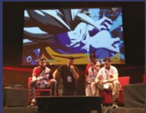
Des démonstrations sur scène.