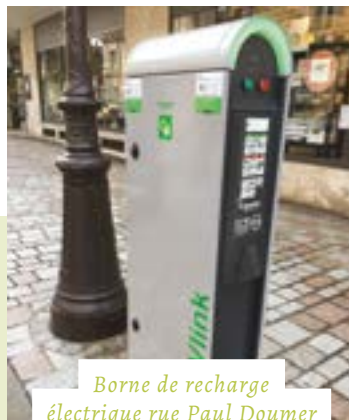
Borne de recharge électrique rue Paul Doumer

Mises en service, les bornes EVlink se situent rue Paul Doumer et Place de l'Ermitage pour une recharge électrique à partir de 1,80 euros. Avec une carte RFID ( mon.freshmile.com ) ou sur place avec votre smartphone, payez en toute tranquillité et rechargez votre voiture, scooter ou vélo ! #GoGreen