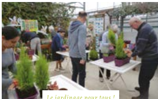
Le jardinage pour tous !

Les ateliers de jardinage écologique de la Ville de Melun ont été créés en 2012 dans le cadre des actions de l'Agenda 21 local porté par Marie-hélène Grange,