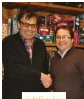
La Bulle de Jeux

La Bulle de Jeux - 5 rue de Boissettes - 09 84 16 09 59. Du mardi au samedi de 10h à 20h et le dimanche de 13h à 20h.