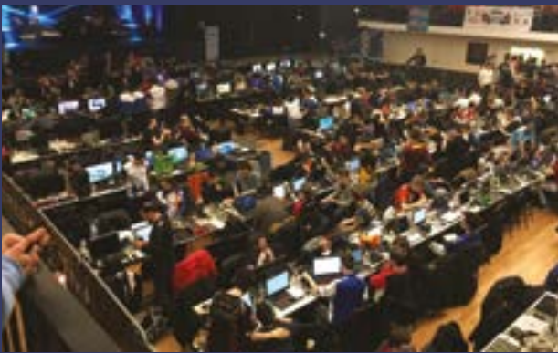
Une salle pleine à craquer...