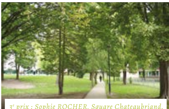
3 e prix : Sophie ROCHER, Square Chateaubriand.