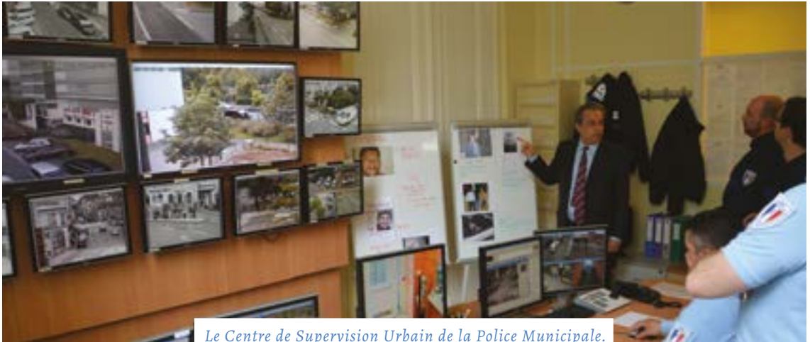
Le Centre de Supervision Urbain de la Police Municipale.