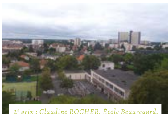
2 e prix : Claudine ROCHER, École Beauregard.