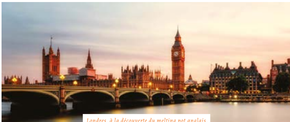
Londres, à la découverte du melting pot anglais.