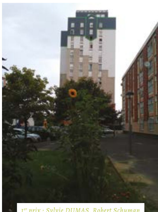
1 er prix : Sylvie DUMAS, Robert Schuman

Le vote a eu lieu lors des fêtes des quartiers de Montaigu et de Schuman par plus de 130 participants, à partir d'une exposition des 30 meilleures photos. Les gagnants sont :