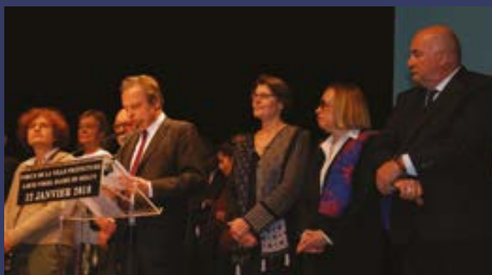
Une très belle cérémonie des vœux à l'Escale !

Ce début d'année fut intense ! Outre les événements climatiques qui ont bouleversé notre quotidien, la Municipalité a voté un budget équilibré en phase avec les orientations données par le Maire lors de la cérémonie des vœux : un meilleur cadre de vie, plus de sécurité tout en améliorant nos finances.