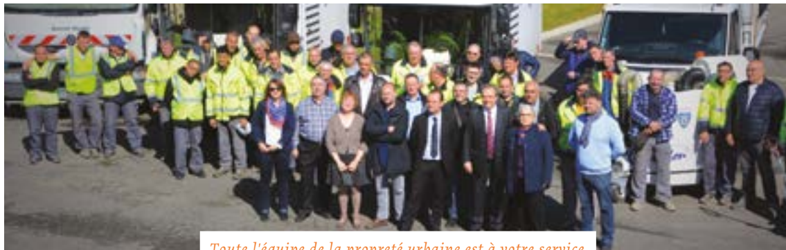
Toute l'équipe de la propreté urbaine est à votre service.