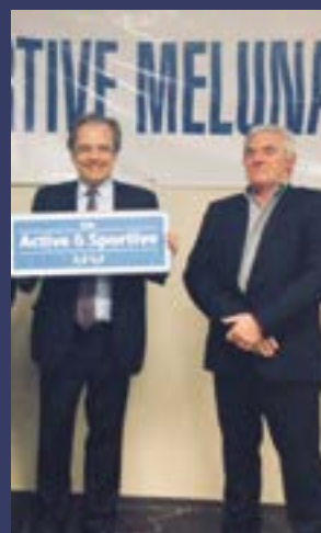
Deux lauriers pour Melun !